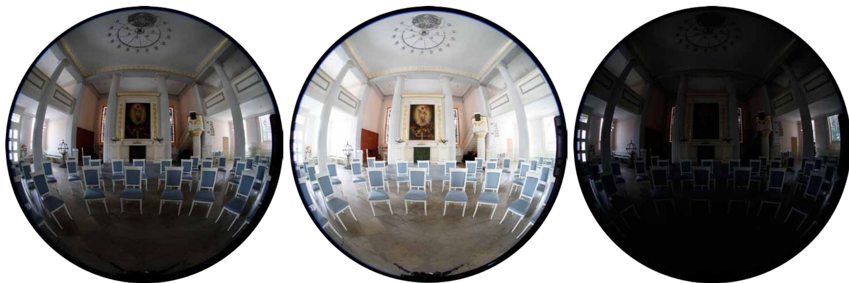
Normalbelichtet 0 eV

Um den hohen Dynamikumfang bei stark unterschiedlichen Belichtungsverhältnissen umzusetzen, wird in jeder Aufnahme eine Belichtungsreihe aufgenommen. Diese drei Aufnahmen werden zu einem HDR-Bild (high dynamic range) zusammengerechnet und durch die Detailverstärkung für normale Ausgabegeräte nutzbar gemacht.